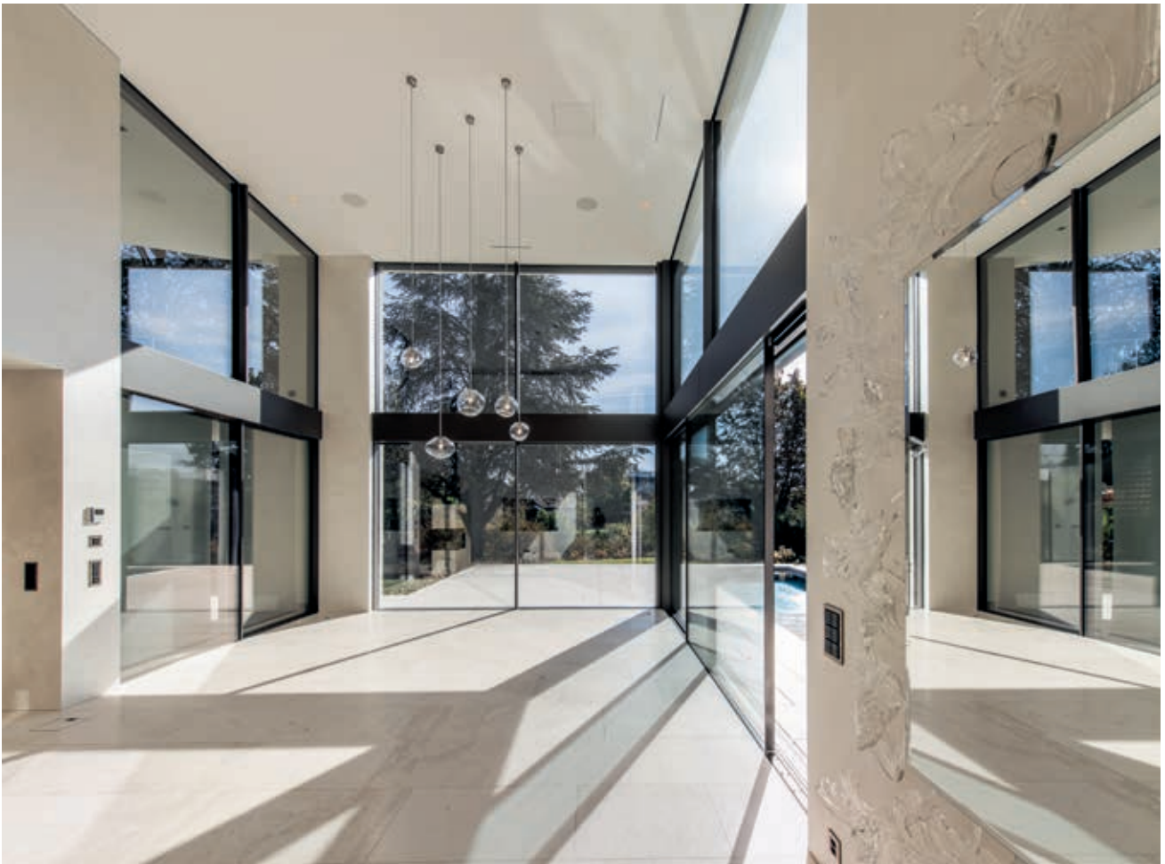
Der Wohnbereich mit seinen überhohen Glasfronten verschmilzt mit der Umgebung.