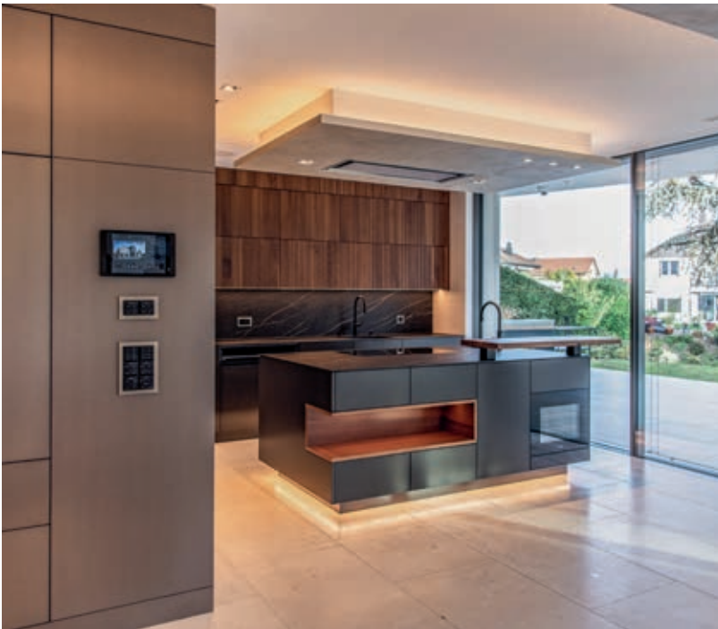
Über die KNX-Taster werden auch in der Küche Licht, Raumtemperatur und Audio gesteuert.