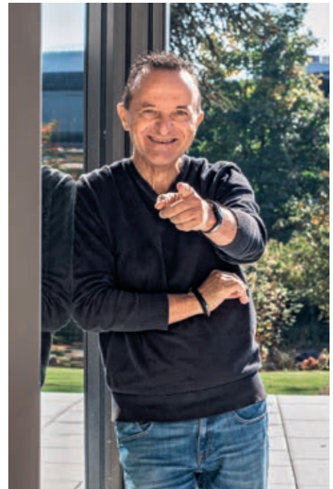
Der Bau von Architekt Rudolf Neff lässt keine Wünsche offen.

Bedarf auch sämtliche aktuell am Markt verfügbaren Sprachsteuerungsassistenten in das System integriert werden.